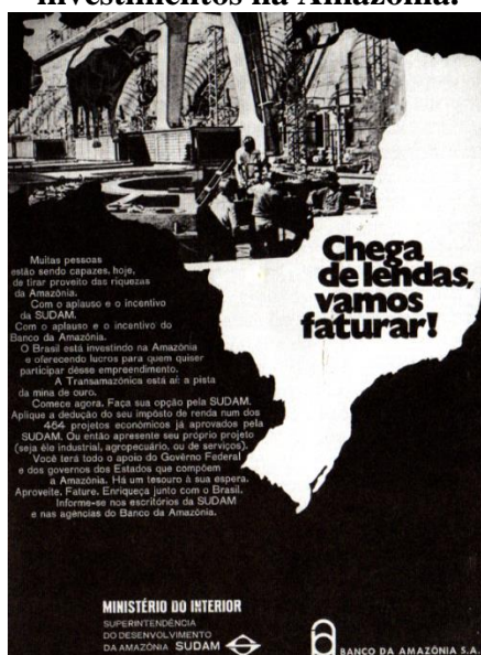
Figura 01: Anúncio do Ministério do Interior/BASA anuncia sucesso de investimentos na Amazônia.

O anúncio publicado abaixo nos dá uma visão do olhar dos governos militares em relação à região. A Amazônia é representada como possibilidade de negócio, de enriquecimento. Com negócios que seriam feitos não com recursos da floresta. Esta teria que ser devastada, substituída pela indústria, pela criação de gado, pela extração de madeiras e principalmente pelo abandono de toda uma cultura de viver na floresta.